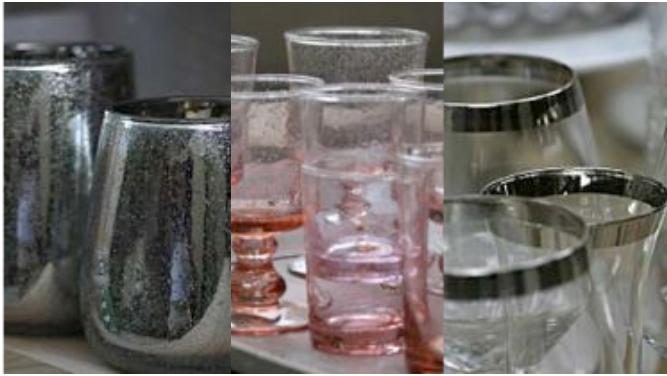
Subtile combinatie zilver met zacht rose

vernieuwde uitstraling te geven. Met kaarsen, plaids en kussens maakt u uw eigen seizoen sfeer compleet! Kijk op www.ptmdstylestore.nl voor prachtige producten en u hoeft er niet eens voor weg! PTMD heeft nu ook de online store, zeker een bezoekje waard. U vindt de collectie van PTMD ook in verschillende woonwinkels en tuincentra.